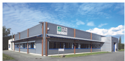
Firmensitz der Delta Dore Schlüter GmbH Landau in der Pfalz

Im Jahr 2000 übernahm Delta Dore die damalige Schlüter Electronic. Die daraus entstandene deutsche Niederlassung Delta Dore Schlüter GmbH ist verantwortlich für Vertrieb und Service der Produkte des Handelsbereichs sowie OEM/Industrie im deutschsprachigen Raum (DACH).